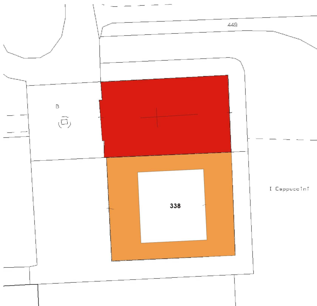
Stralcio di mappa catastale